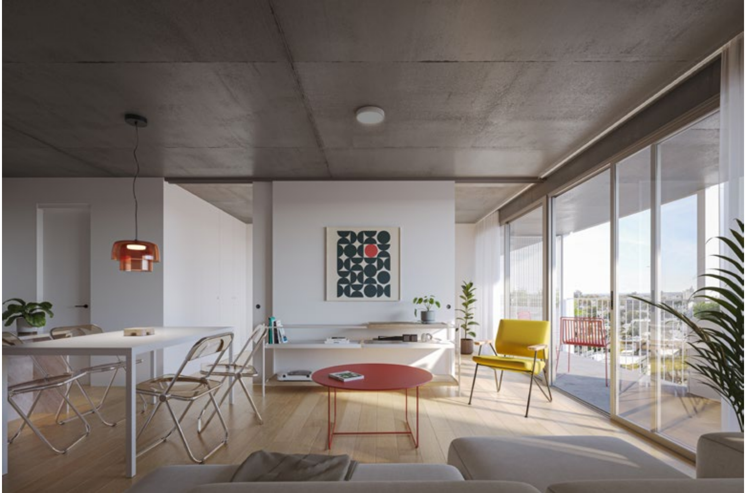
APARTAMENTO 1 DORMITORIO