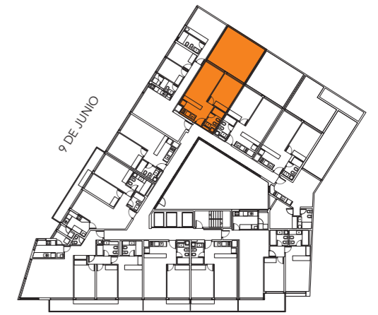
RAMBLA REPÚBLICA DE CHILE